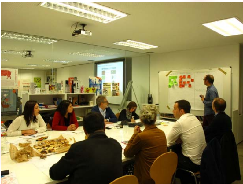
Fotografia 2. Moment de debat en un dels grups de treball.